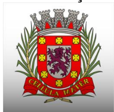
Prefeitura de São Vicente