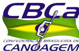
CBCa – Confederação Brasileira de Canoagem